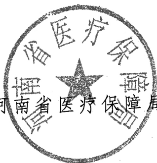
河南省医疗保障局