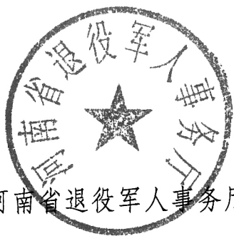
河南省退役军人事务厅