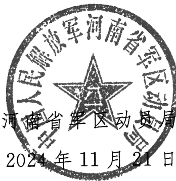
河南省军区动员局