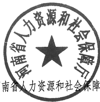
河南省人力资源和社会保障厅